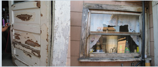
Pintura en casas construidas antes de 1978