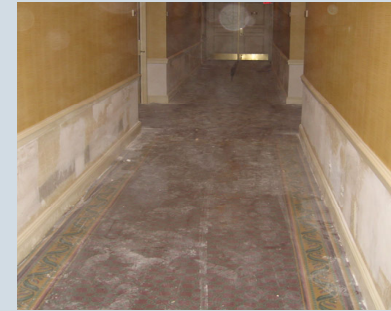
Polvo de plomo