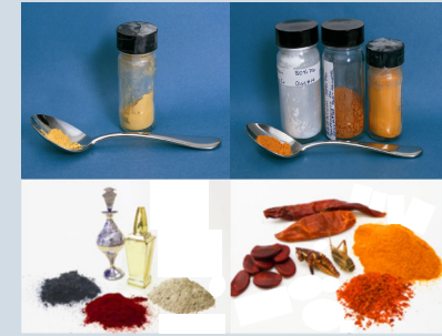
Remedios y Maquillaje tradicionales en polvos