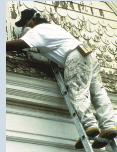
Llevar el Plomo a Casa (Trabajo o Pasatiempo)