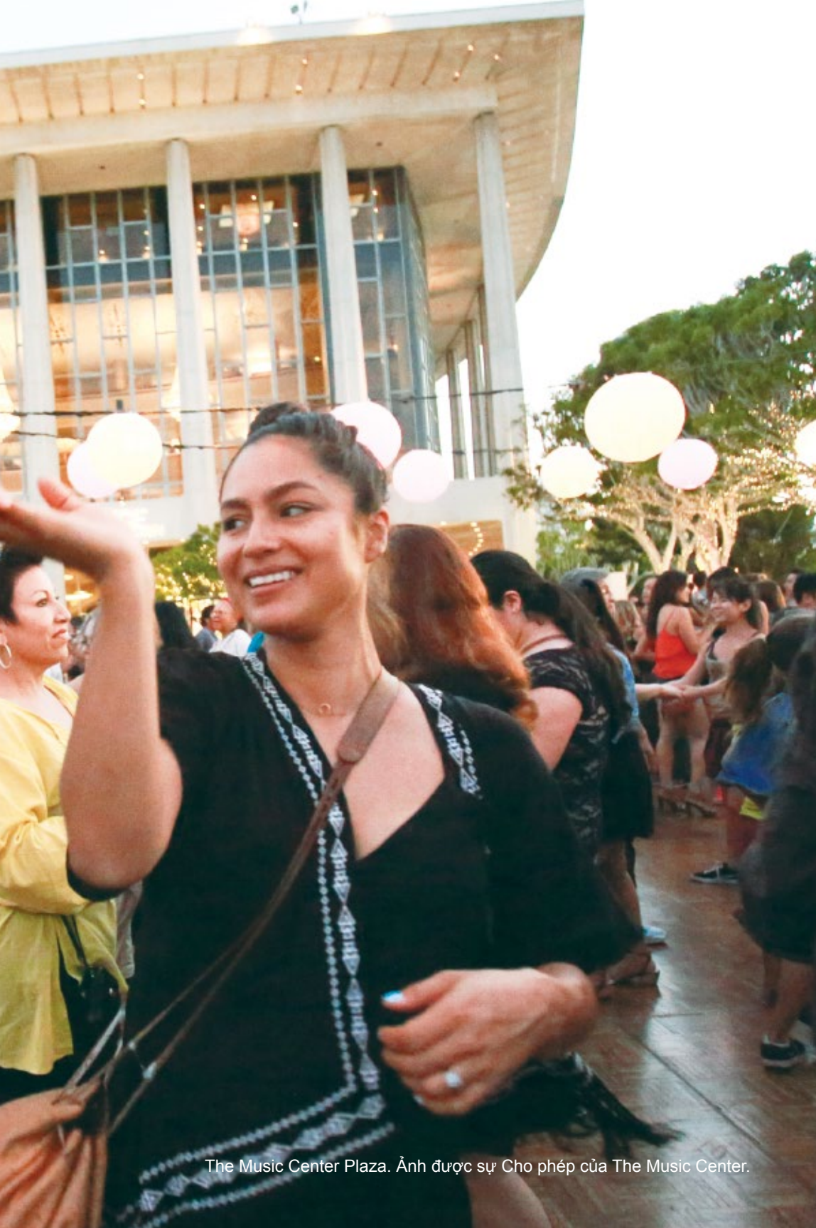
The Music Center Plaza. Ảnh được sự Cho phép của The Music Center.