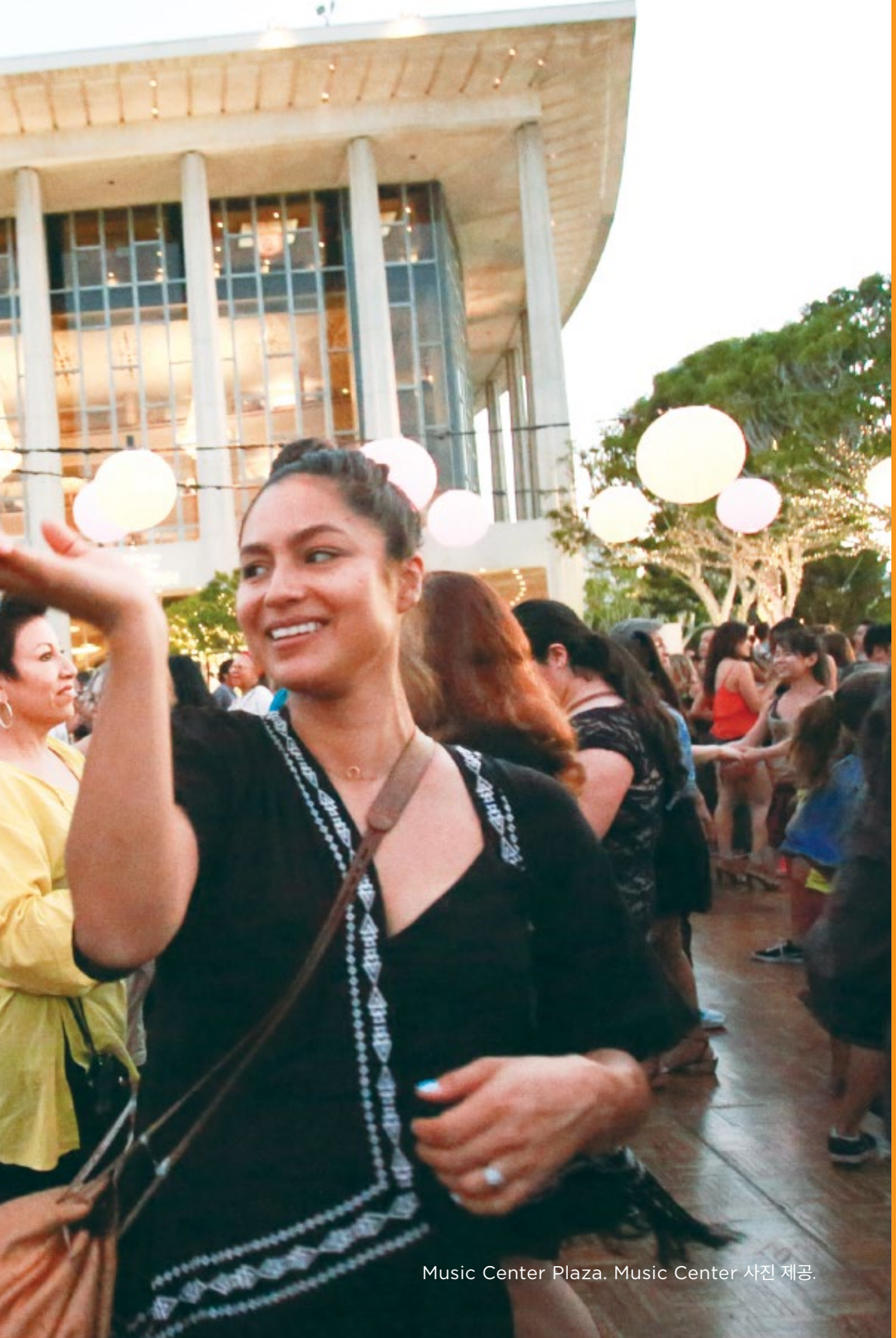
Music Center Plaza.